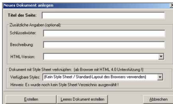
Abb. 1: Dialogfenster beim Erstellen eines neuen HTML-Dokuments.

<html> <head> <title></title> <meta name="author" content="Ulli Meybohm"> <meta name="generator" content="Ulli Meybohms HTML EDITOR"> </head> <body text="#000000" bgcolor="#FFFFFF" link="#FF0000" alink="#FF0000" vlink="#FF0000"> </body> </html>